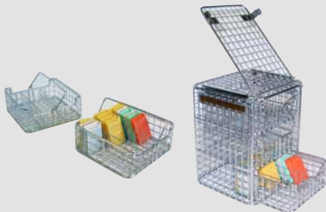
Cestello a modulo organizzato